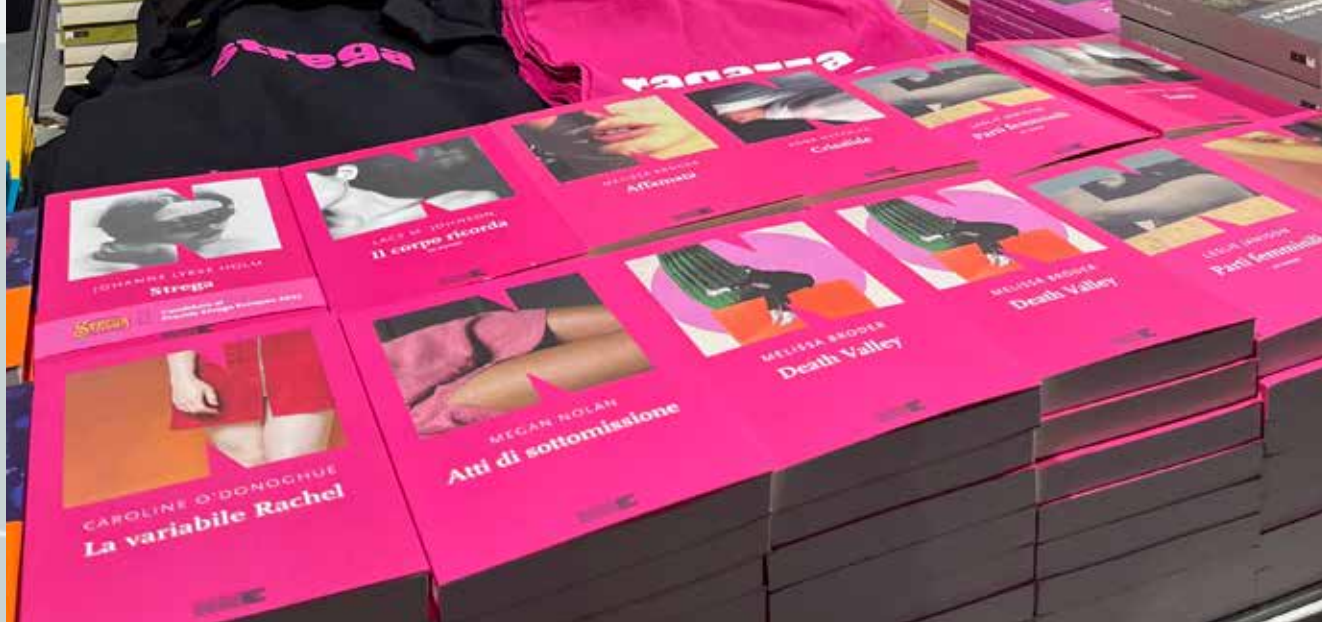
A sinistra: la stagione "Le fugitive", presso lo stand di NN al Salone di Torino.